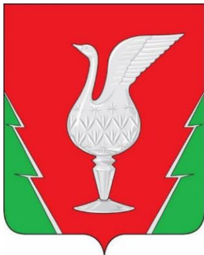
СХЕМА ТЕПЛОСНАБЖЕНИЯ МУНИЦИПАЛЬНОГО ОБРАЗОВАНИЯ ПОС. ВЕЛИКОДВОРСКИЙ (СЕЛЬСКОЕ ПОСЕЛЕНИЕ) ГУСЬ-ХРУСТАЛЬНОГО РАЙОНА ВЛАДИМИРСКОЙ ОБЛАСТИ ДО 2027 ГОДА (АКТУАЛИЗАЦИЯ ПО СОСТОЯНИЮ НА 2024 ГОД)