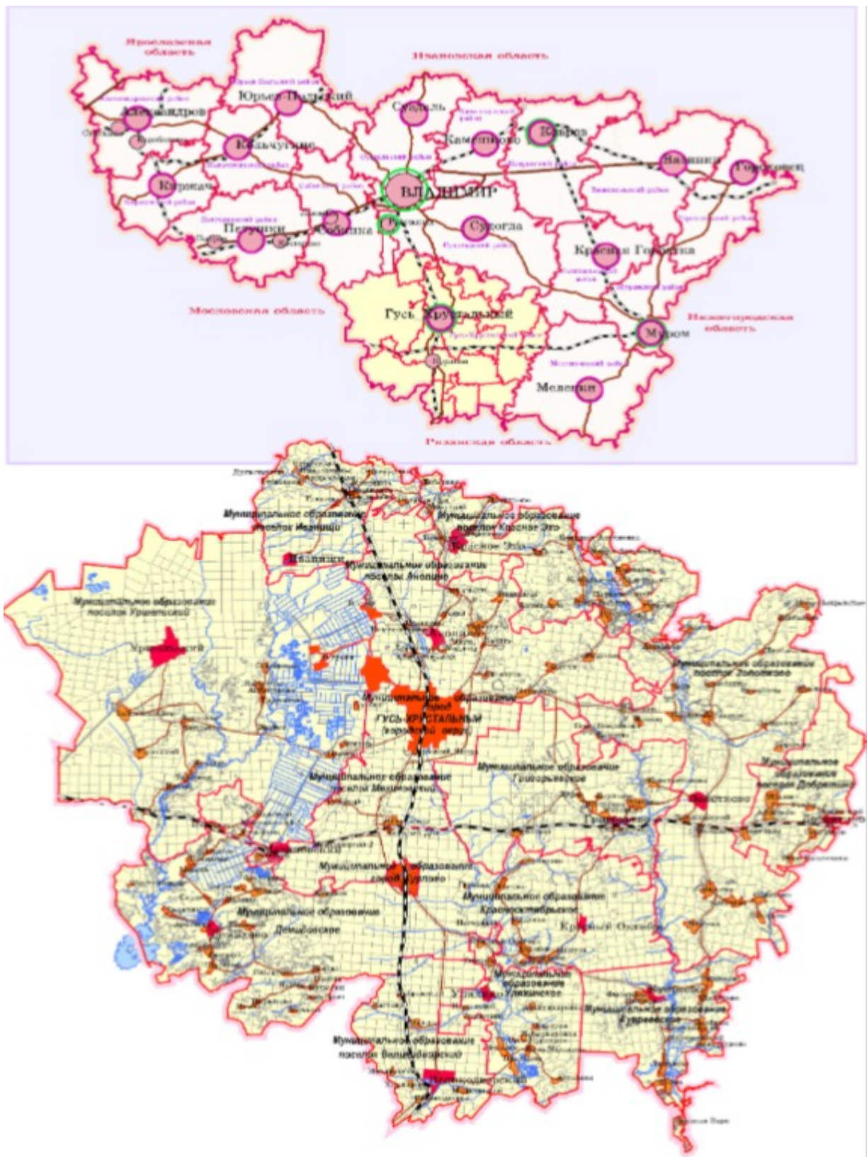
Рисунок 3 – Схема местоположения Гусь-Хрустального муниципального округа в системе внешних связей

По территории Гусь-Хрустального муниципального округа проходит федеральная автомобильная дорога Владимир – Гусь-Хрустальный – Тума. Также округ обслуживает множество региональных и местных дорог,